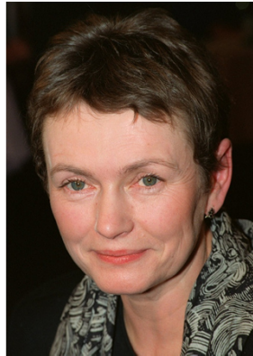
Bärbel BOHLEY (*1945; † 2010) Künstlerin, Oppositionelle und Bürgerrechtlerin in der DDR

«Wir wollten Gerechtigkeit und bekamen den Rechtsstaat.»