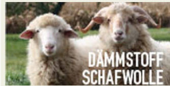
Fislan-High-Tech Produkt aus Schweizer Schafwolle für ein gesundes Wohnklima.